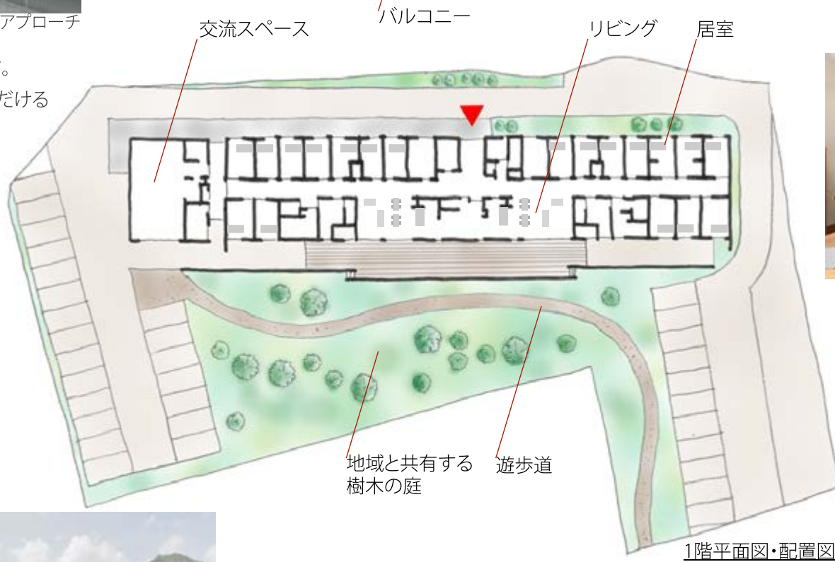
1階平面図・配置図

暮らしとは、一日一日の積み重ね。 身の回りのこと、日常生活での役割、 他者との交流や家族との時間、 そして趣味活動や休息といった 自分の時間など、日常生活のごく当たり前 のことが自然に継続できるよう、 一日の生活をサポートします。