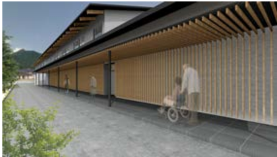
玄関へのアプローチ

外観は日本家屋をモチーフとしています。 住宅街にとけ込み、親しみを感じていただける デザインとしています。 建物から伸びる庇(ひさし)が来場者を 玄関へ優しく迎えます。 ご家族やご友人とどうぞお気軽に お越しください。